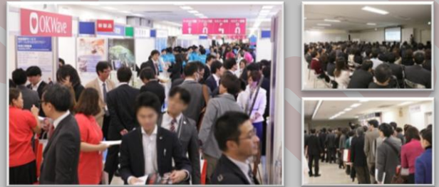
当日の様子

開催日時 : 2013年11月14日、15日 10:00~17:30 開催会場 : 池袋サンシャインシティ 文化会館 コンベンションセンター 出展社数 : 計149社 登録者数 : 計6450名(14日3072名 15日3378名)